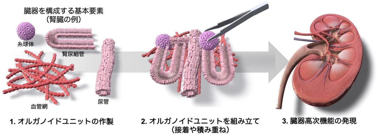
図1：実物大腎臓オルガノイドの構築のための新規手法（Unit construction method）の概要。腎臓を構造や機能に基づいて基本要素（オルガノイドユニット）に分割し、それぞれのオルガノイドユニットを個別に作製する。その後、ユニットを組み立てて実物大の腎臓オルガノイドを構築する。図はサイエンス・グラフィックス株式会社により作成。