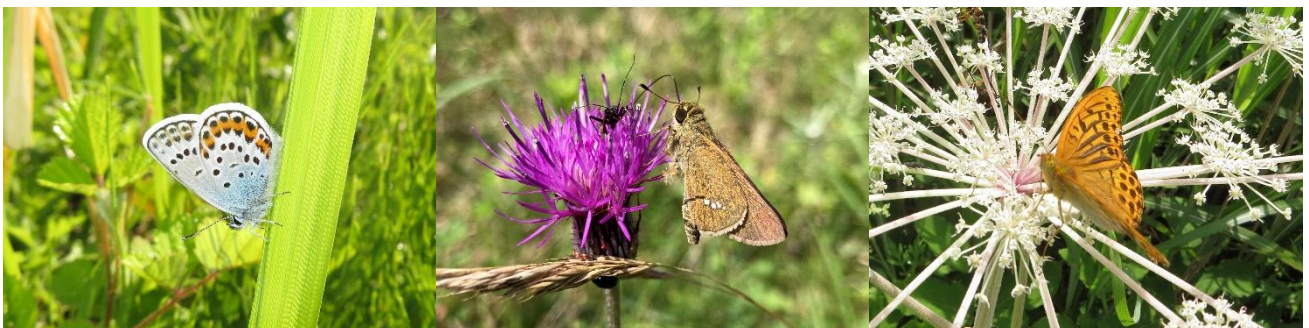
図2. スキー場の営業停止からの経過年数が増えるにつれて、観察されにくくなったチョウの一部。左からヒメシジミ（草地性種）、イチモンジセセリ（荒地性種）、ミドリヒョウモン（森林性種）。