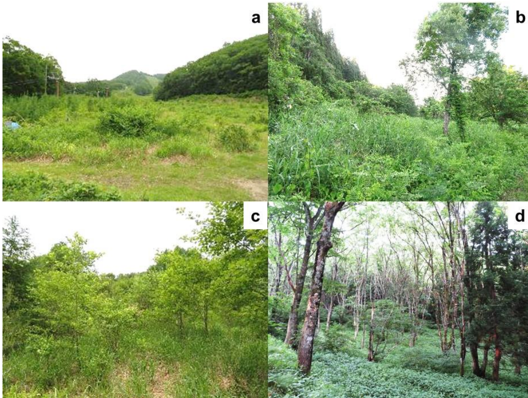
図1. スキー場としての営業停止後の経過年数の異なるスキー場跡地の様子（aは1年後、bは16年後、cは33年後、dは46年後）。